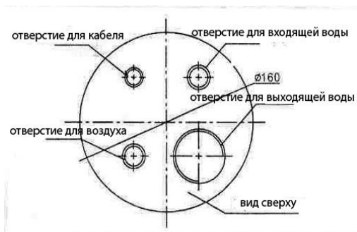
Рис. №1 Вид сверху