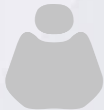
XH 12-6 Light Grey