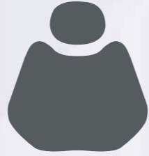
HX 001-32 Grey