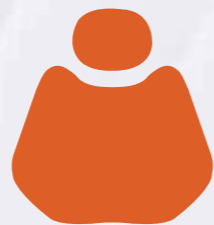
PU 07 Orange