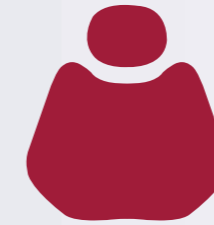
H 015 Rose