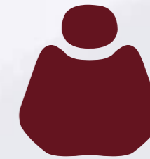
FS 04 Begoniared