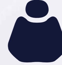
H 004 Dark Blue