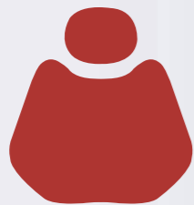
HX 001-78 Bordeaux