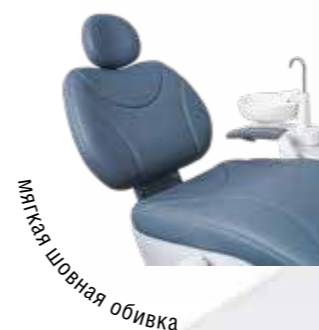
мягкая шовная обивка