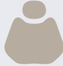
HX 001-31 Ivory