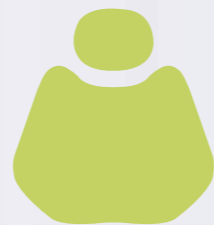
PU 08 Grass Green