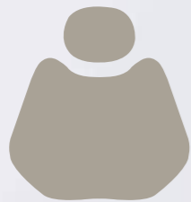
XH 12-52 Middle Grey