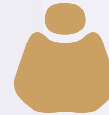
H 007 Orange