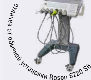
на расстоянии от основной установки Roson 6220 S6