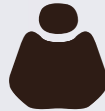
FS 01 Modern Brown