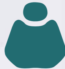
XH 12-54 Green