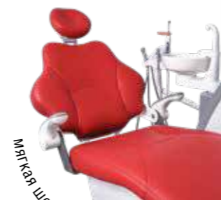
Мягкая шовная обивка