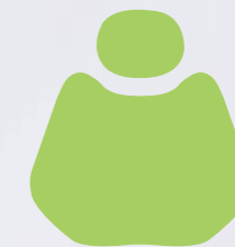
FS 08 Lighte Green