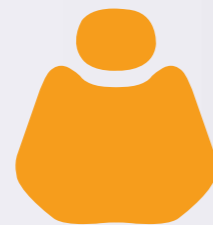
PU 06 Yellow