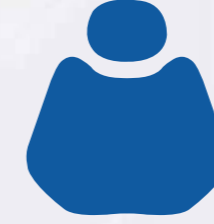
H 003 Middle Blue