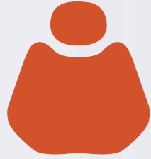
HX 001-12 Orange