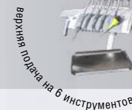
Верхняя подача на 6 инструментов