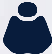
PU 04 Navy Blue