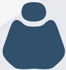
HX 001-11 Dark Blue