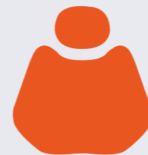
FS 05 Hermes Orange