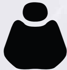
XH 12-72 Black