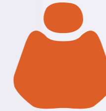
H 016 Nacarat