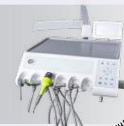
нижняя подача на 6 инструментов