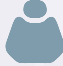
H 002 Grape