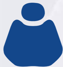
PU 03 Sky Blue