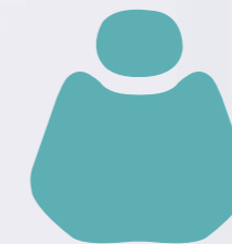
FS 07 Tiffany Blue