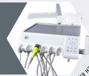
нижняя подача на 6 инструментов