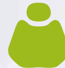
FS 06 Olive Green