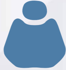
HX 001-51 Light Blue