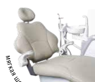
Мягкая шовная обивка