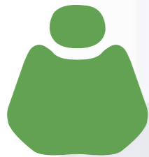
HX 001-9 Jewel Green