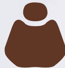
HX 001-97 Brown