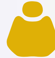
H 006 Mango Yellow