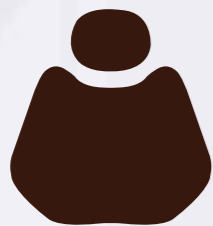
PU 01 Amber Brown