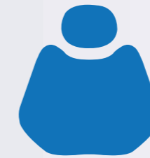
FS 02 Coloured Glaze Blue