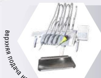
верхняя подача на 6 инструментов