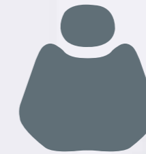
FS 03 Gray