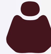
H 008 Claret