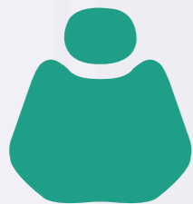
PU 05 Lake Green