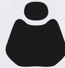
H 010 Black