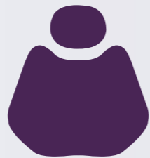
XH 12-64 Purple