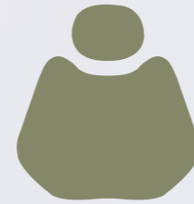
H 014 Grey