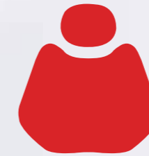
H 011 Red