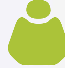
H 009 Apple Green