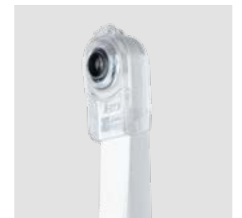
Macro Cap Macro Cap – чрезвычайно полезный аксессуар, способный увеличивать изображение до 100 раз в сверхвысоком разрешении. Три дополнительные линзы из стекла высокой чистоты оптимизируют освещение деталей, расположенных вблизи оптического блока.