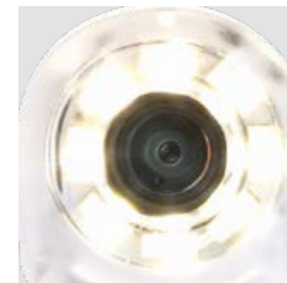
Видеокамера C-U2 HD Видеокамера облегчает коммуникацию стоматолога и пациента. Узкая конструкция наконечника позволяет с лёгкостью достигать дистальных зон. Превосходная глубина резкости исключает необходимость ручной фокусировки. Ускоряет процесс диагностики, получает материал для документирования лечения и составления клинических заключений.