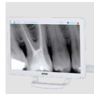
Светодиодный монитор 22" Монитор имеет сертификат EЭС 93/42. Также доступна версия Multitouch, в которой положение экрана можно изменять по желанию.

Медицинский монитор Full HD 16:9 с регулируемым наклоном и плоским экраном диагональю 1920 x 1080 пикселей дополнен видеокамерой HD последнего поколения. Подключается к компьютеру с помощью кабеля. Светодиодные источники света обеспечивают высокий уровень контрастности и яркости, а панель IPS, которая значительно расширяет диапазон видимости экрана, позволяет удобно просматривать изображения в любом ракурсе.