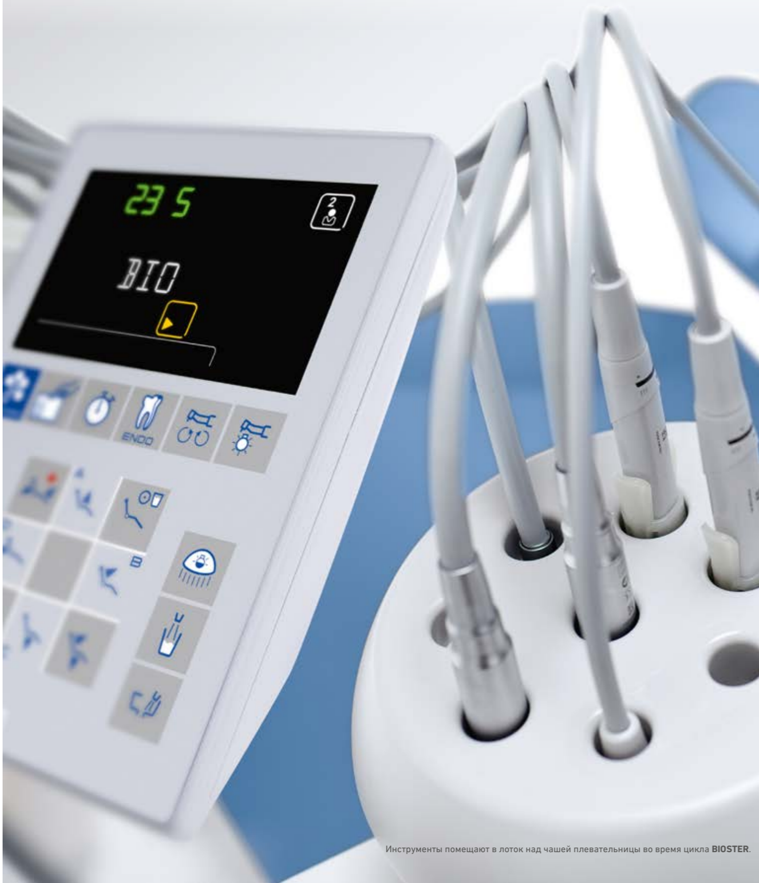
Инструменты помещают в лоток над чашей плевательницы во время цикла BIOSTER .

Услугам стоматологов предлагается широкий выбор активных медицинских устройств для укомплектования стоматологической установки по своему желанию. Также в их распоряжении имеются конструкторские решения с набором функций для защиты пациентов и хирургического персонала.