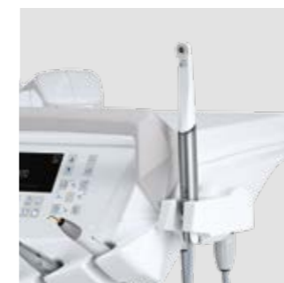
Шестой инструмент Модуль стоматолога модели International может быть укомплектован дополнительным шестым инструментом: видеокамерой или светодиодной лампой (T-LED).